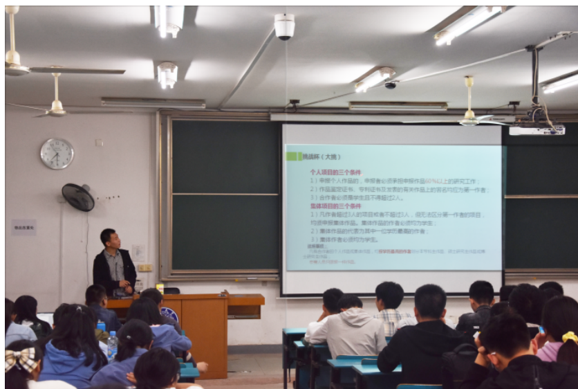
工作量认定及奖励

7、作品及所附的有关材料一般应是中文（若是外文，请附中文本），哲学社会科学类学术论文及社会调查报告可包含被采用的为党政领导部门、企事业单位所做的各类发展规划、改革方案和咨询报告，同时附上原件及采用单位使用证明的复印件和有关鉴定材料。